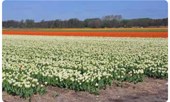
Kleurrijke bollenvelden langs de Gooweg in Noordwijkerhout