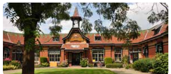
Leeuwarden - Gabbema Gasthuis