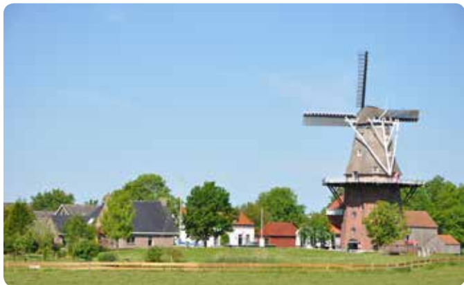
Molen "De Zwaluw" in Birdaard (Burdaard)