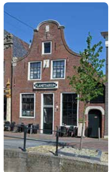
Franeker - Planetarium