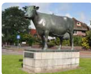
Leeuwarden - Us Mem