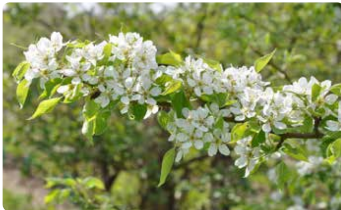
Appelbloesem in de Betuwe