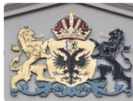
Gemeentewapen van Tiel

We verlaten Tiel via de N835 in noordelijke richting en volgen de borden naar het dorpje Zoelen .