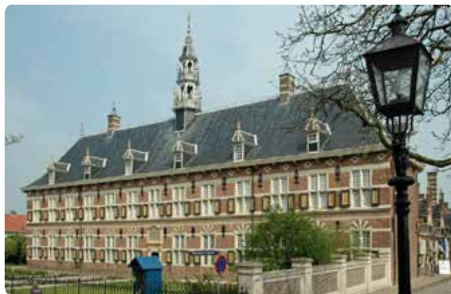
Buren - Voormalig koninklijk weeshuis >

Eveneens aan de Weeshuiswal zien we een ANWB-informatiebord over de middeleeuwse muurtoren van Buren.