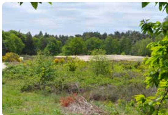
Kaapse Bossen bij Doorn