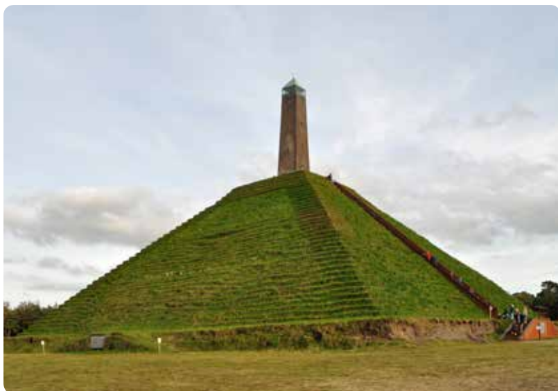
De Pyramide van Austerlitz werd opgericht op 12 oktober 1804 ter herinnering aan het verblijf van een 18.000 man grote Franse legermacht op de Utrechtse heide.

We rijden 16 km verder over de N224. Nadat we Scherpenzeel en Woudenberg zijn gepasseerd volgen we de borden naar Austerlitz. Bij de parkeerplaats van de Pyramide van Austerlitz (Zeisterweg 98) zetten we onze auto neer en wandelen ca. 400 meter het bos in naar de voet van dit bijzondere bouwwerk.