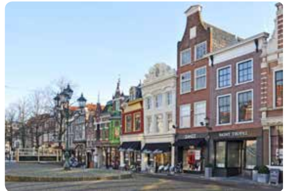
Historische huizen langs de Mient