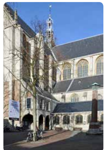
De Grote of Sint-Laurenskerk gezien vanuit de Koorstraat >