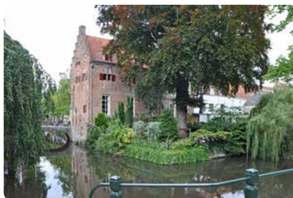
Huis "Groot Tinnenburg" op Muurhuizen 25