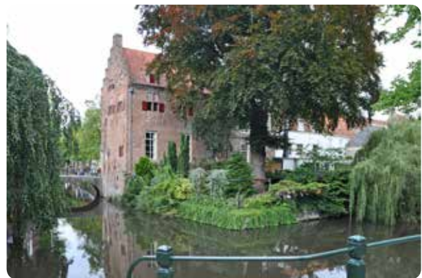
Huis "Groot Tinnenburg" op Muurhuizen 25