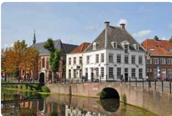
Pittoresk stadsgezicht: Hoek Westsingel - Kleine Spui