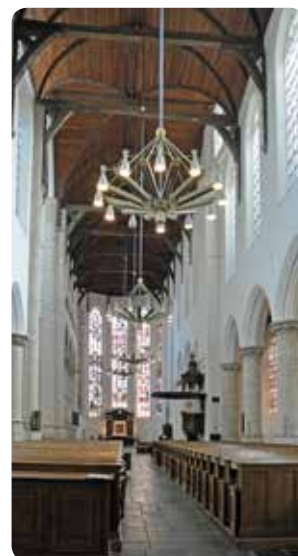
Interieur Oude Kerk >