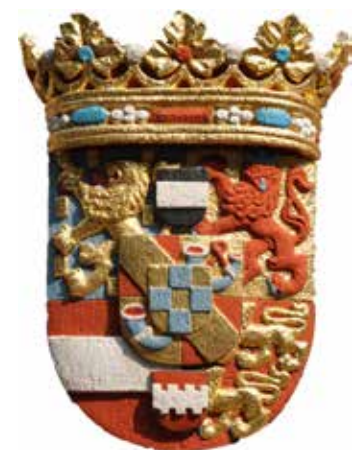
Wapen Willem van Oranje