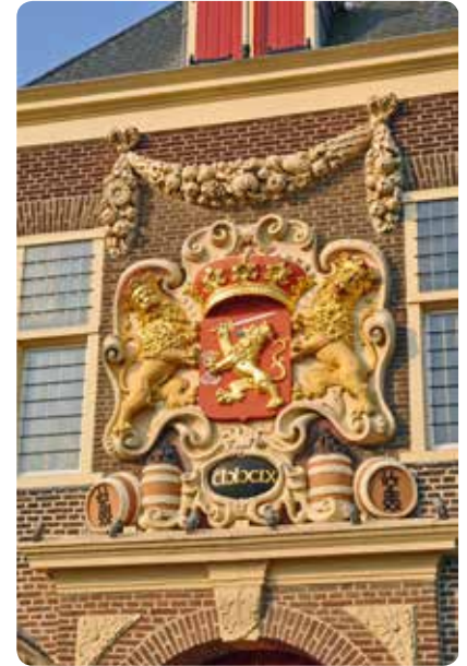
Wapen Staten Generaal op poortgebouw Kruithuis (Schiekade)