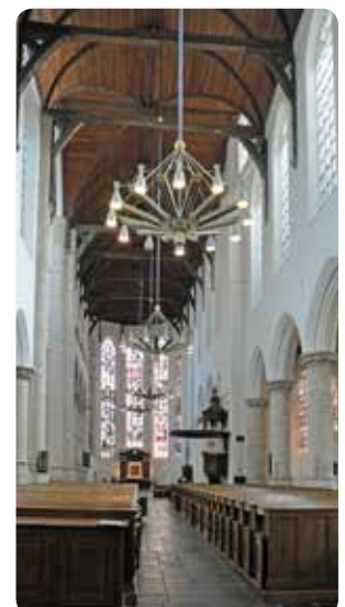
Interieur Oude Kerk >