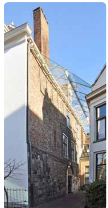
De Proosdij aan de Sandrasteeg 8 >