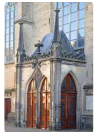
Hoofdingang van de Broederenkerk >

We gaan linksaf de Pontsteeg in. Een kleine 30 meter verderop wandelen we rechtsaf de Broederenstraat in. Recht voor ons zien we de voorzijde van de 14 e eeuwse Broederenkerk .