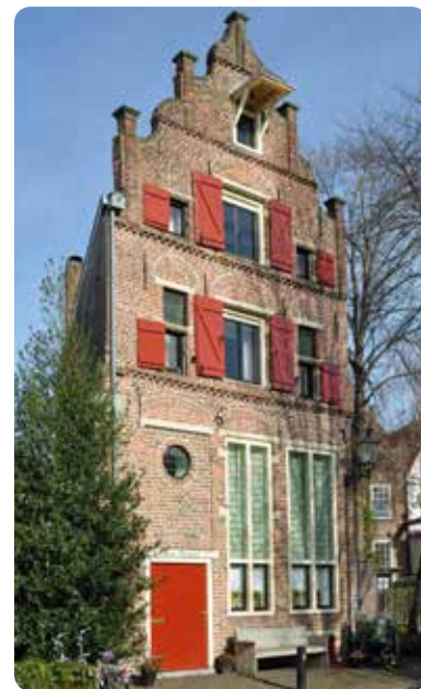
Woonhuis uit 1612 op Rijkmanstraat 13