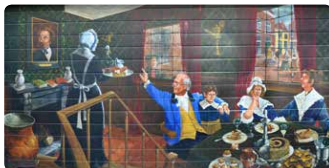
Een tafereel uit "De Pickwick Papers" van Charles Dickens als muurschildering in de Walstraat