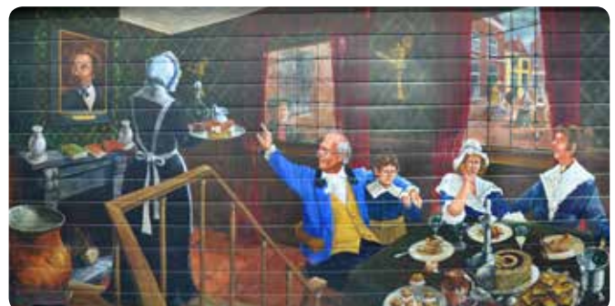
Een tafereel uit "De Pickwick Papers" van Charles Dickens als muurschildering in de Walstraat