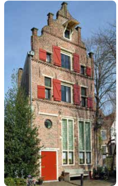
Woonhuis uit 1612 op Rijkmanstraat 13