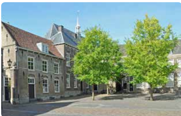
Het Hof van Nederland