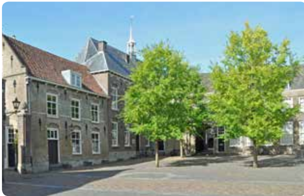
Het Hof van Nederland