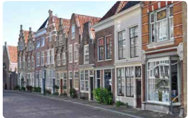
De fotogenieke Hofstraat

We steken Het Hof recht over en komen terecht in de Hofstraat .