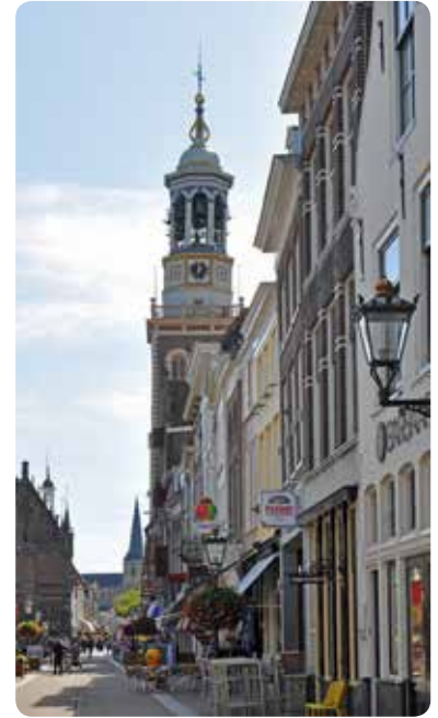
Zicht op de Nieuwe Toren