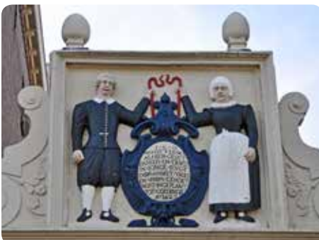
Sierstuk bovenop het Weeshuispoortje, vervaardigd in 1627

We wandelen een klein stukje terug over de Vloeddijk en gaan rechtsaf over de Burgel de Geerstraat in. Zodra we na 80 meter de Boven Nieuwstraat bereiken gaan we opnieuw rechtsaf. Bij huisnr. 6 lopen we het poortje door en komen terecht in één van de minder bekende bezienswaardigheden van de Kamper binnenstad: de Espagnoltuin!