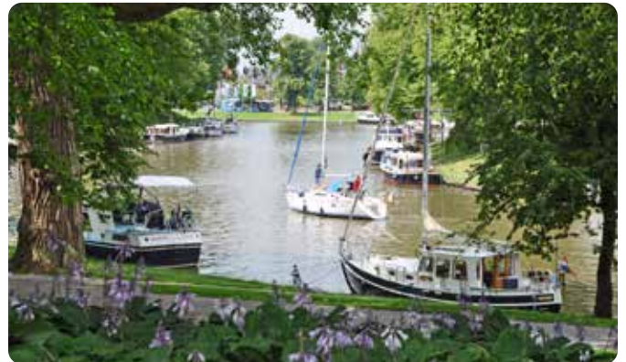
Noorderstadsgracht gezien vanuit de Prinsentuin