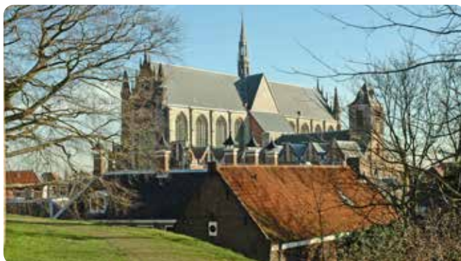
De Hooglandse Kerk