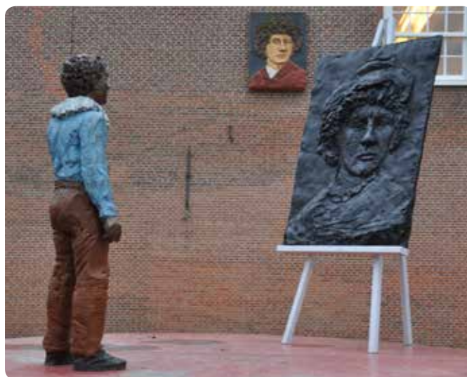
Standbeeld van jonge Rembrandt op de Rembrandtplaats