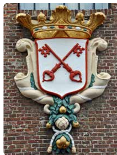
Gemeentewapen van Leiden