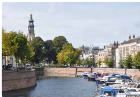
Prins Hendrikdok met toren Nieuwe Kerk