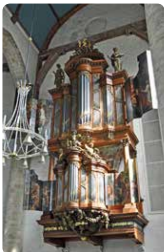
< Het Van Leeuwen-orgel (1954) in de Nieuwe Kerk