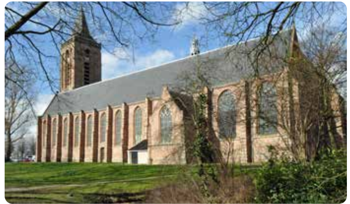
Grote of Sint-Nicolaaskerk