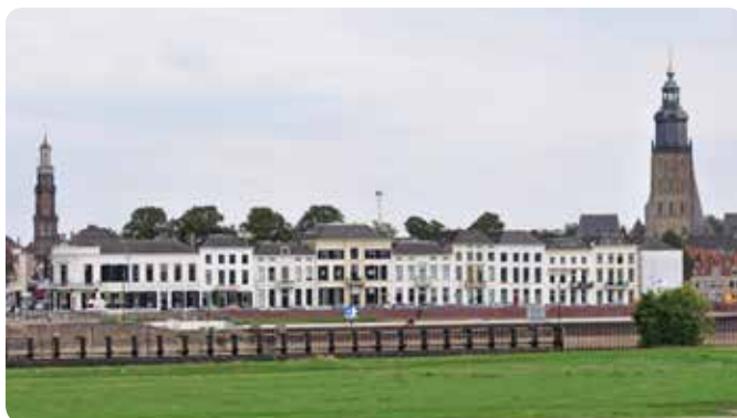
Skyline van "Torenstad" Zutphen