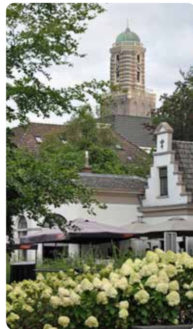
Zicht op de Peperbustoren